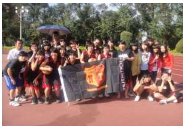
食營盃： 全台營養及食品相關科系聯合球類比賽，熱情！盛大！有趣！