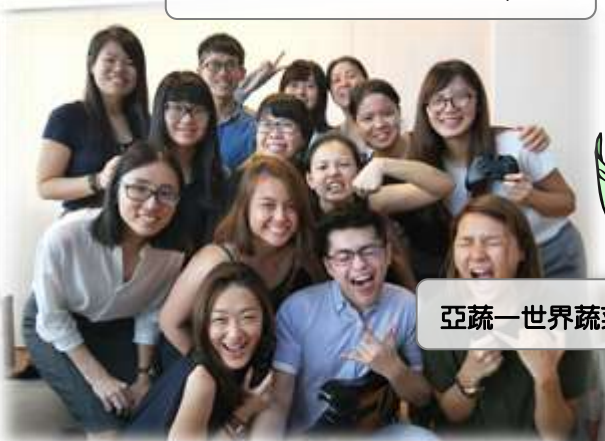
亞蔬-世界蔬菜中心