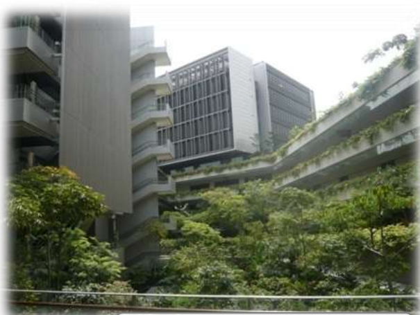
新加坡 Khoo Teck Puat Hospital