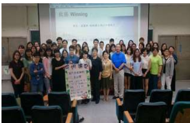
學術演講： 針對不同主題邀請各界成功人士或傑出系友返校演說。