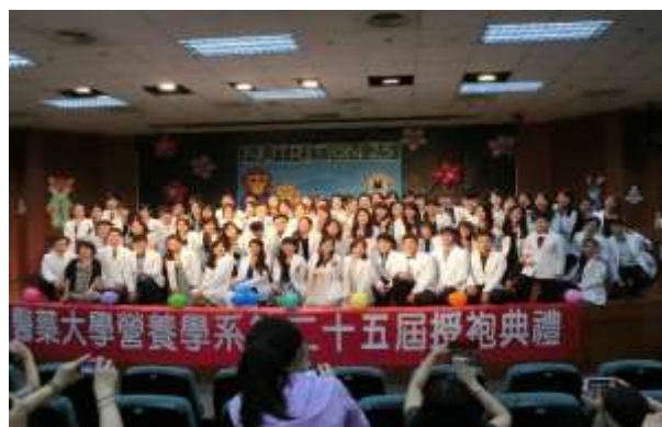
授袍典禮： 為大三即將到醫院實習的學長姊們獻上最大的祝福。