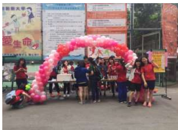
系週： 為期一週的活動，販售自製商品及玩遊戲。