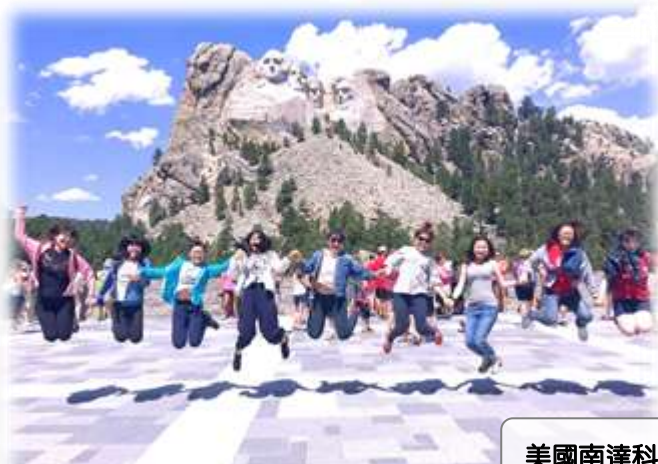
美國南達科達州立大學